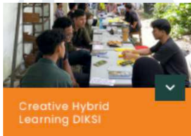
Gambar 2. 8 DIKSI

Sekolah Sosial Forestri (SESORE) adalah sebuah inisiatif yang dirancang untuk membentuk anak muda yang memiliki pengetahuan dan kepedulian terhadap isu-isu kehutanan. Program ini dijalankan melalui berbagai kegiatan belajar, seperti Village Landscape Model , Academia Movement , Creative Hybrid Learning (DIKSI), serta Lingkar Belajar Sosial Forestri, yang semuanya menjadi wadah pengembangan pemahaman dan keterampilan tentang pengelolaan hutan.