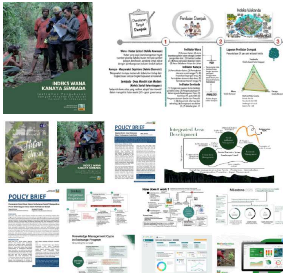
Gambar 2. 9 Indeks WAKANDA

Salah satu kegiatan dalam DIKSI adalah Lokakarya “Selaras Hutan Jawa,” yang membahas hasil penelitian terbaru tentang kondisi hutan di Jawa. Di sini, para peserta berdiskusi dan mencari cara untuk menjaga kelestarian hutan dengan lebih baik.