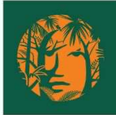
Gambar 2. 2 Logo Stand Alone