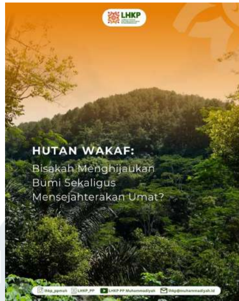
Gambar 2. 6 Hutan Wakaf

LATIN akan membentuk sebuah kelompok kerja atau aliansi yang melibatkan berbagai pihak yang peduli pada hutan adat dan hutan milik masyarakat. Aliansi ini akan menjadi ruang belajar bersama untuk membahas pengelolaan hutan di luar kawasan hutan negara. Anggotanya mencakup berbagai organisasi dan lembaga seperti BRWA, HuMa, AMAN, KPSHK, Arupa, Jaringan Advokasi Hutan Jawa, FKMM, akademisi, Kaoem Telapak, serta perwakilan pemerintah pusat. Tujuannya adalah memperkuat kerja sama dan memahami cara terbaik mengelola hutan adat dan hutan rakyat secara berkelanjutan (LATIN, 2021).